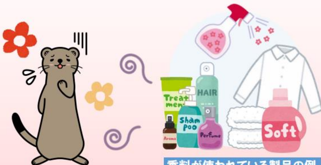
群馬県消費生活センター 消費者被害防止啓発キャラクター「ジョー」