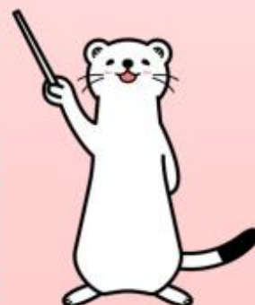
群馬県消費生活センター 消費者被害防止啓発キャラクター 「オーコ」

学校や公共施設、公共交通機関など、人が集まる場所では、洗剤、柔軟仕上げ剤、香水などの香りが過度にならないように配慮しましょう！