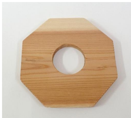
No.1 「なべしき」 糸鋸で切りました。 【価格】200円