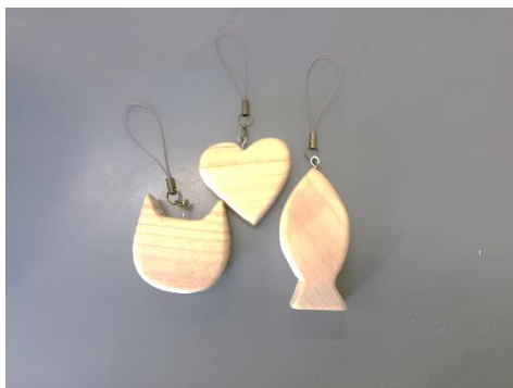
No.7 「キーホルダー」 今年度試作の新製品です。 【価格】200円（1個）