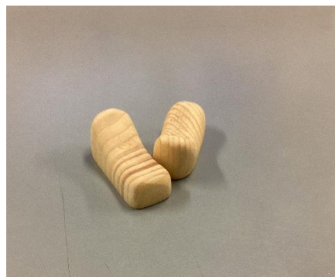
No.6 「箸置き」 コロんとしたかわいい箸置きです。 【価格】150円（2個）