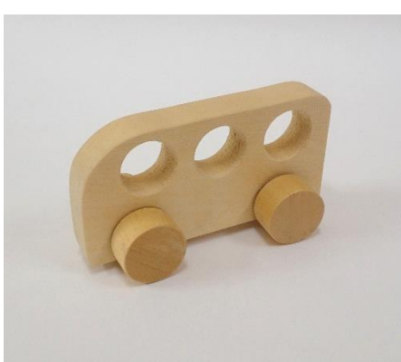
No.5 「バスのおもちゃ」 手で転がして遊べるバスです。 【価格】150円