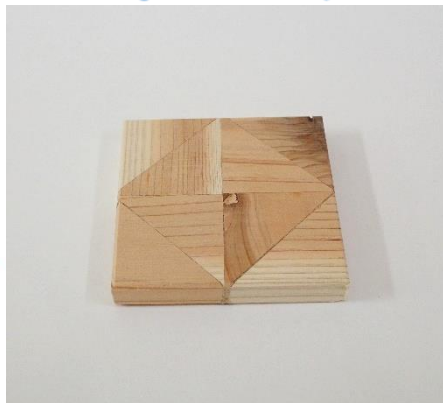
No.2 「コースター」 がんばって各ピースを削りました。 【価格】150円