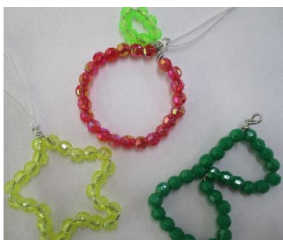
No.7 「オーナメント」パーティ