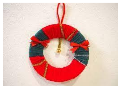
No.2 「クリスマスリース」