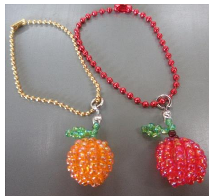
No.3 「ころころフルーツ」