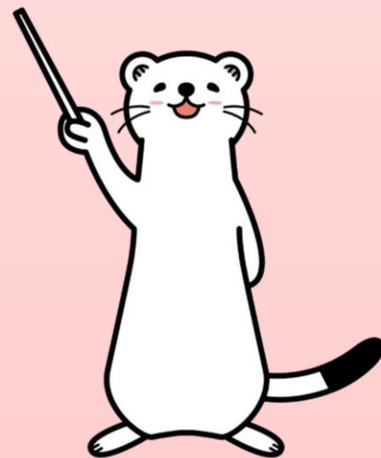
群馬県消費生活センター 消費者被害防止啓発キャラクター 「オーコ」

学校や公共施設、公共交通機関など、人が集まる場所では、洗剤、柔軟仕上げ剤、香水などの香りが過度にならないように配慮しましょう！